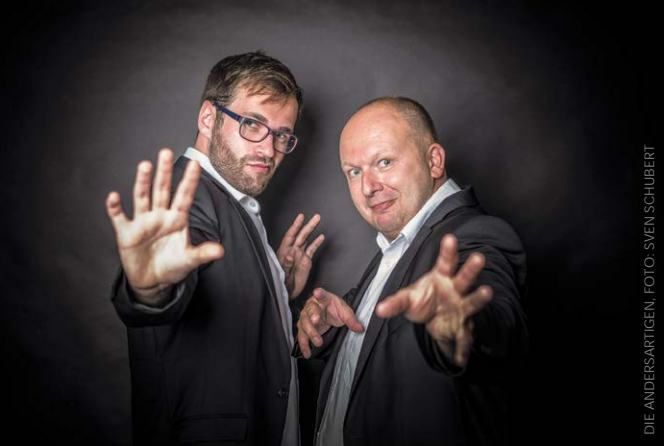
DIE ANDERSARTIGEN