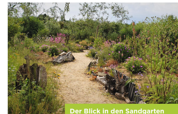
Der Blick in den Sandgarten der NABU-Naturarena

Offene Sonntage NABU-Naturarena 2024 Jeweils 11-17 Uhr 5. Mai, „Tausende Gärten – Tausende Arten“ 2. Juni, „Wanzen-Führung“ 7. Juli, „Jahreswesen 2024“ 4. August, „Tiere pflanzen“ 1. September, „Insekten“ 6. Oktober, Herbstmarkt