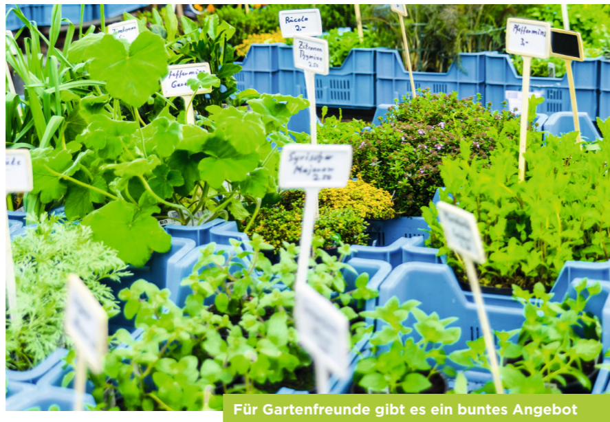
Für Gartenfreunde gibt es ein buntes Angebot

In der Fußgängerzone, zwischen Leyens-Platz und Berliner Tor, präsentieren sich Anbieter mit einer Vielzahl an Angeboten rund um den Drahtesel. Das vielfältige Angebot umfasst unter anderem Stände von Fahrradhändlern, Polizei, ADFC, Fitnessstudios sowie Sanitätshäusern. Die Kreispolizei Wesel bietet die beliebte Fahrradcodierung an, der ADFC seine Gebrauchtradbörse. Einen Helm- und Reaktionstest kann man bei der Kreisverkehrswacht absolvieren und bei dem Stand der Stadt Wesel gibt es Informationen