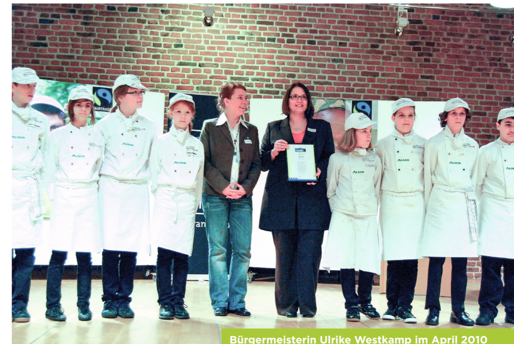
Bürgermeisterin Ulrike Westkamp im April 2010 bei der ersten Zertifizierung zur Fairtrade Town

Der Nachhaltigkeitsgedanke wird am 7. April 2024 im Rahmen des Frühlingfestes mit verkaufsoffenem Sonntag erstmals eine Plattform erhalten. Der „Ort der Nachhaltigkeit“ am Leyens-Platz – unmittelbar vor dem Eine-Welt-Laden – bietet