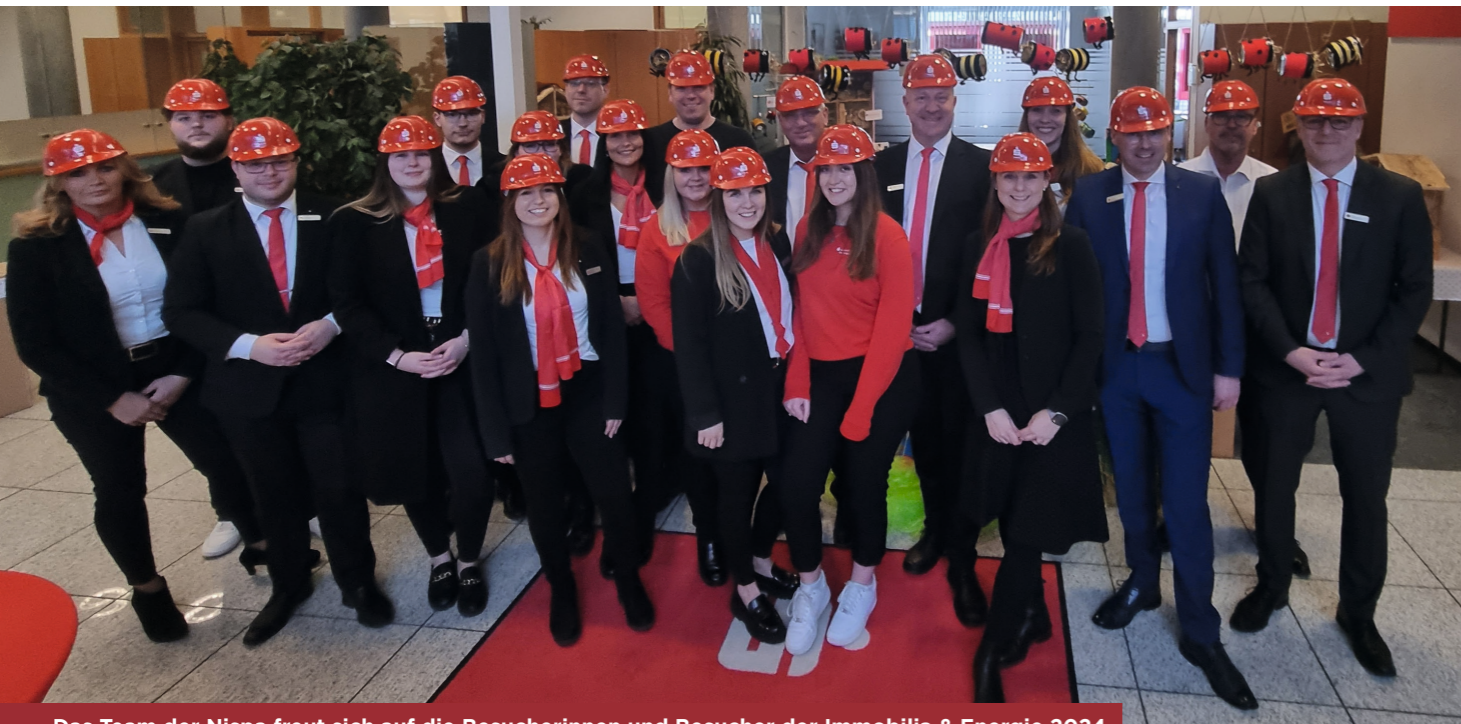
Das Team der Nispa freut sich auf die Besucherinnen und Besucher der Immobilia & Energie 2024

Die Niederrheinische Sparkasse RheinLippe (Nispa) lädt am 6. und 7. April zur Immobilia & Energie ein. Die beliebte Veranstaltung steht in diesem Jahr unter dem Motto Kaufen, Sanieren und Energiesparen.