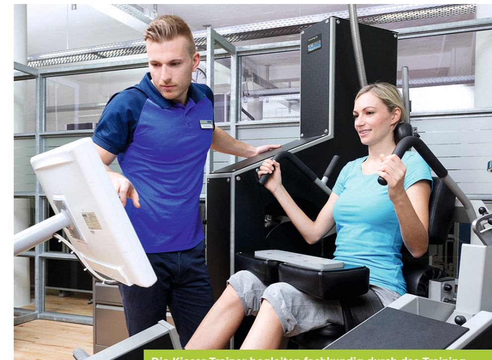
Die Kieser Trainer begleiten fachkundig durch das Training

Als eines der ersten Unternehmen in Europa erkannte Kieser die gesundheitsfördernde Qualität von Krafttraining und setzte dafür konsequent auf Maschinen. Auch über 50 Jahre später ist Kieser dem eigenen Konzept treu geblieben und trotzdem der Zeit wieder voraus. Die Maschinen wurden in Eigenregie immer weiter spezialisiert, stets unter Berücksichtigung der aktuellsten medizinischen Erkenntnisse. Das gewährleistet maximale Trainingseffekte bei minimalem Zeitaufwand: zweimal 30 Minuten pro Woche reichen aus, um den Körper nachhaltig zu stärken und Schmerzen am Bewegungsapparat spürbar zu reduzieren.