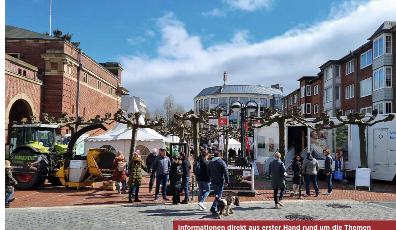
Informationen direkt aus erster Hand rund um die Themen Energiesparen, erneuerbare Energien und Förderprogramme

Die Spezialistinnen und Spezialisten der Nispa präsentieren eine vielfältige Auswahl an Immobilien. Zum 16. Mal bietet die Nispa allen Interessierten eine Plattform, um sich über aktuelle Trends und Standards zu informieren. Ein buntes Rahmenprogramm bietet auch für die Kleinsten tolle Attraktionen, unter anderem eine Hüpfburg und eine Bastelaktion.